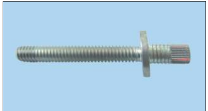
Tornillo a presión