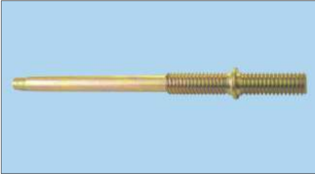
Cierre doble rosca