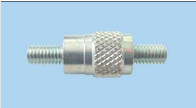
Cierre doble rosca con meleteado